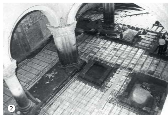
Basilica di S. Flaviano - secc. VI-XI