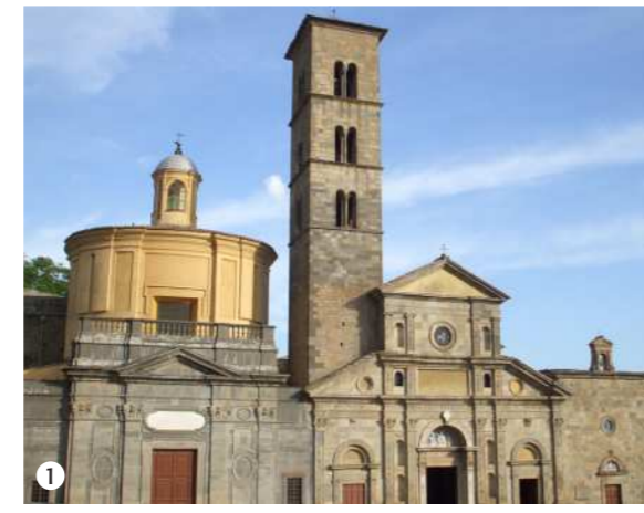
1 Basilica di S. Cristina - secc. IV-XI