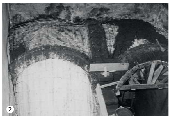
Palazzo Alemanni - sec. XVI