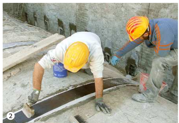
Chiesa del SS. Crocifisso - sec. XVI