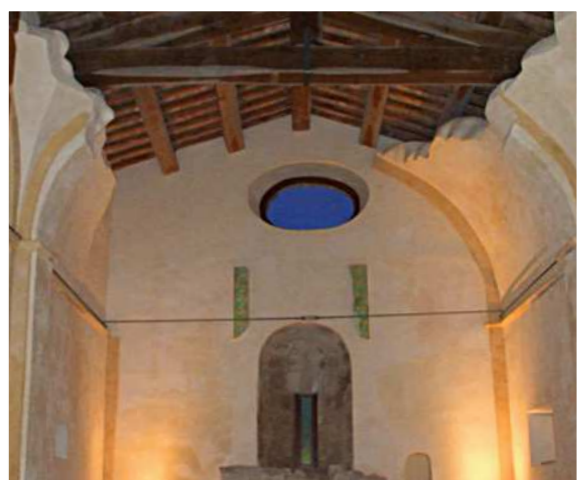
Sito Templare di Castell'Araldo - sec. XIII